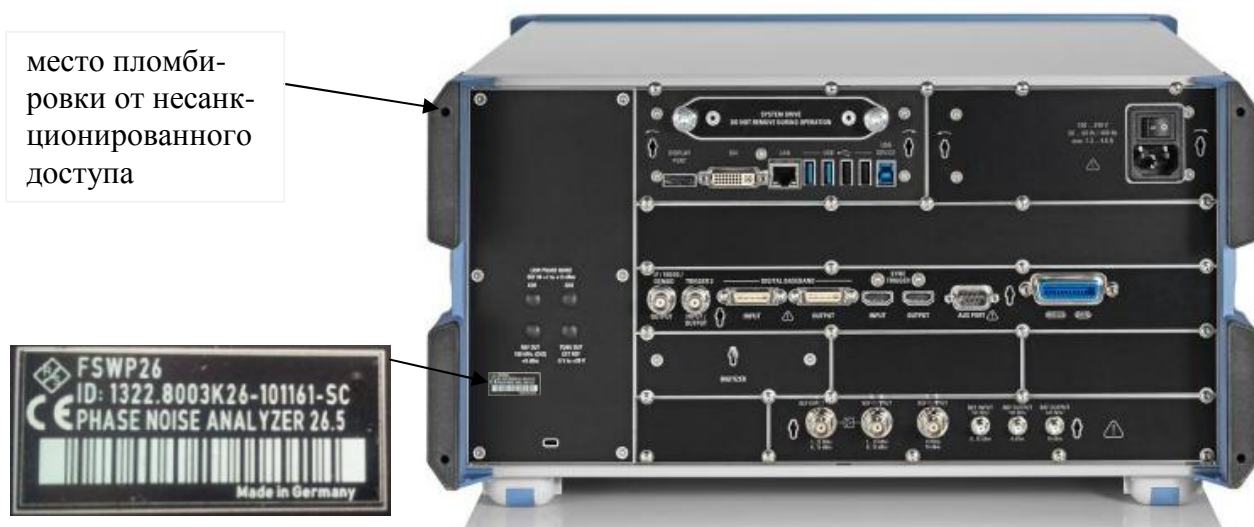
Рисунок 2 - Схема пломбировки от несанкционированного доступа и размещения наклеек