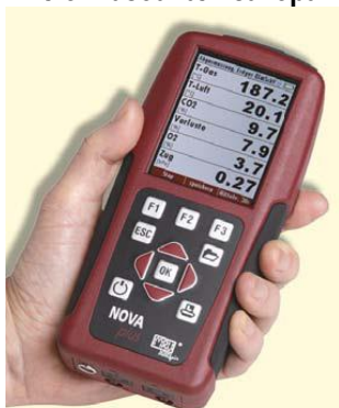
Беспроводной управляющий модуль (управление до 100 м)