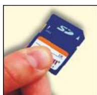
SD карта для хранения и обмена данными (формат Excel)