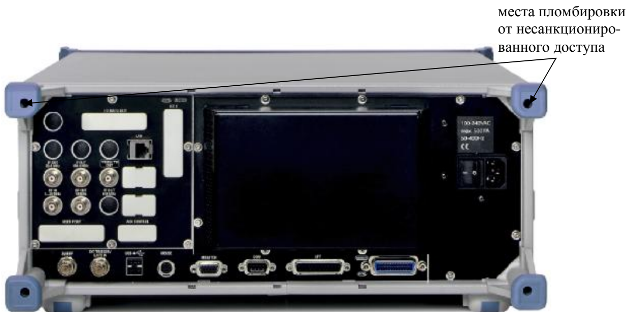
Рисунок 2 - Схема пломбировки от несанкционированного доступа

Схема пломбировки от несанкционированного доступа, приведена на рисунке 2.